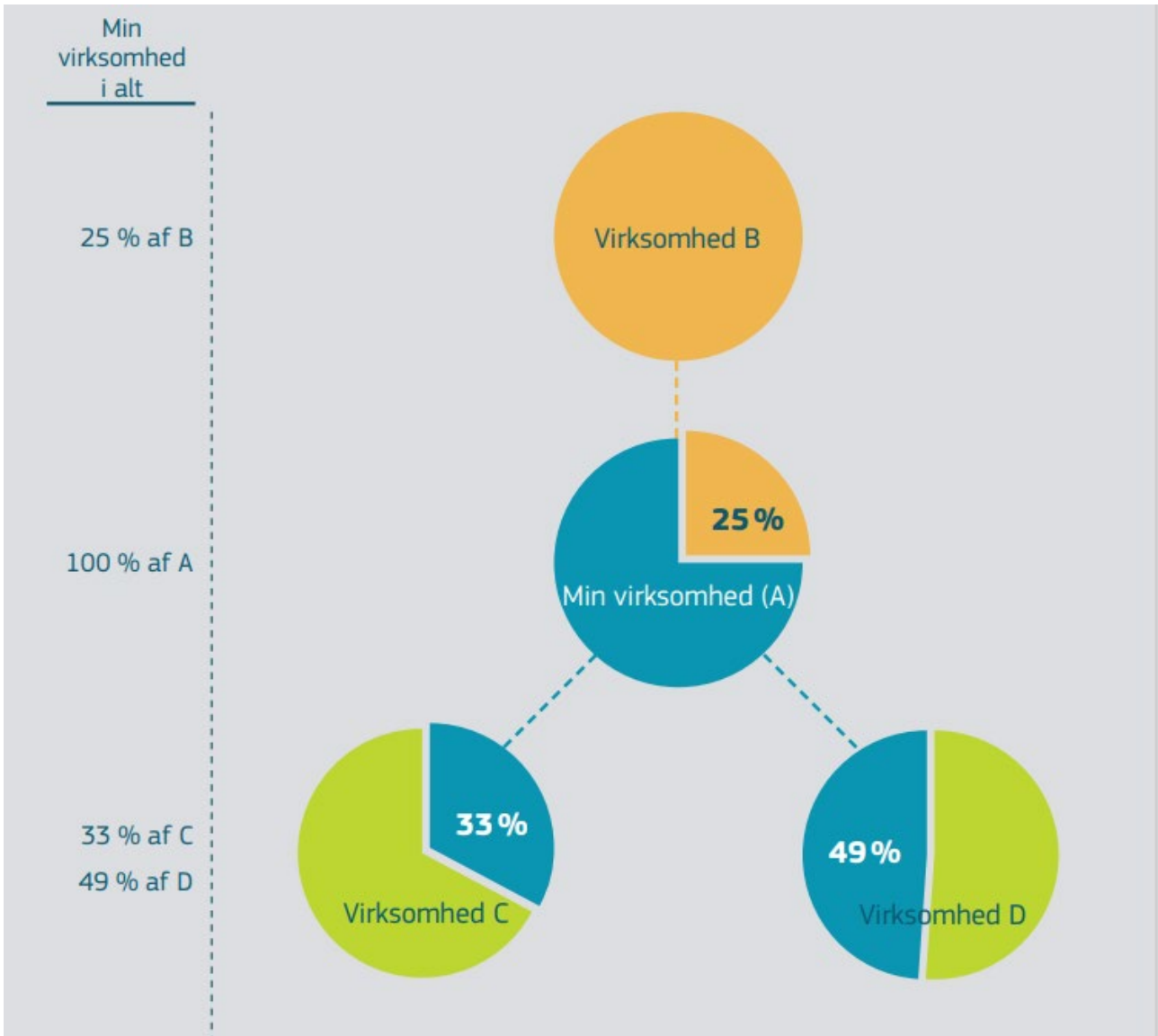
Figur 1: Eksempel på beregning af data for partnervirksomheder, hvor min virksomhed i alt = 100 % af A + 25 % af B + 33 % af C + 49 % af D.

beregningen af mit antal beskæftigede og mine finansielle data lægger jeg de relevante procentdele af dataene for B, C og D til mine samlede data.